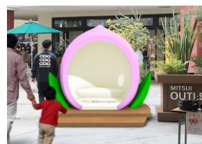
※画像はイメージです。