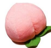
※画像はイメージです。

※ご投稿いただいた内容はアカウント名とともに当キャンペーンサイトに順次掲載いたします。