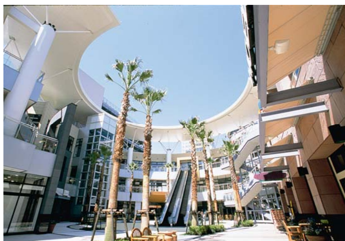
「三井ショッピングパーク ららぽーと TOKYO-BAY」外観