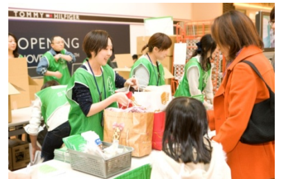
2012 年 11 月（第 8 回）実施時の様子