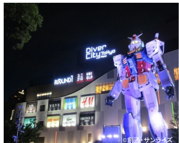
「ダイバーシティ東京 プラザ」外観