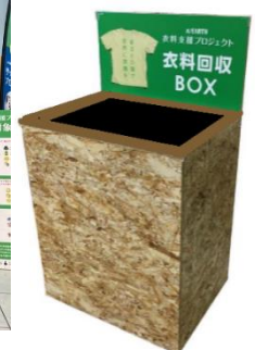
前回の衣料品回収風景(2023年5月)