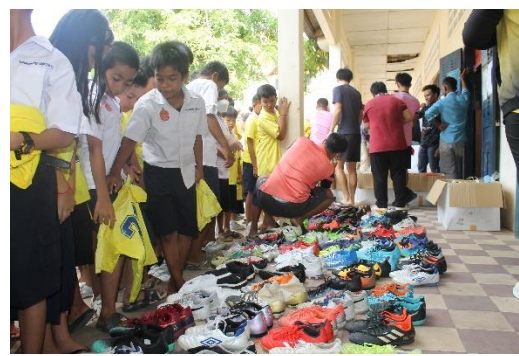
カンボジアでのサッカー用品寄贈の様子(2023 年 6 月)