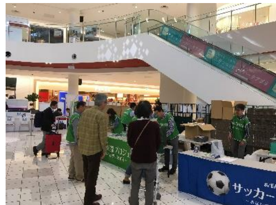
会場でのサッカー用品回収の様子