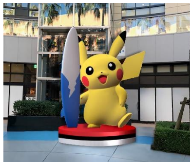
※イラスト・写真はイメージです。