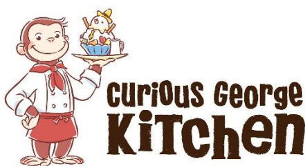
Curious George Kitchen 2023年7月5日（水）オープン

三井不動産商業マネジメント株式会社（東京都中央区）が運営する『RAYARD MIYASHITA PARK』（東京都渋谷区）は、期間限定店舗を含む新店舗を今夏オープンいたします。また、7月1日（土）よりSPECIAL OFFや夏季限定メニューの販売など、夏を盛り上げる特別なバーゲン「ミヤパ・ザ・バーゲン サマー！」を開催いたします。