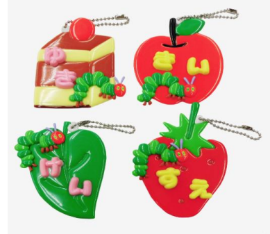
おなまえホルダーイメージ

みついショッピングパーク キッズクラブ会員様限定 先着200名様※10時より整理券配布 ※開催時間等詳細はラゾーナ川崎プラザホームページにて ご確認ください。