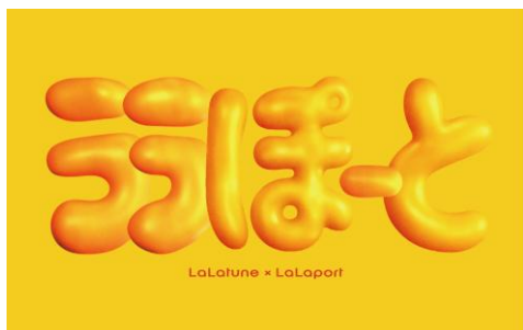
【限定ステッカーイメージ】

タイアップを記念して、ららぽーとTOKYO-BAY館内でもスペシャルな特典をご用意。「ららぽーとの“らら”」を「ラランドの“ララ”」に変更し、「ララチェーン」のオープニングロゴ風のデザインに落とし込んだ「“ララ”ぽーと」ステッカーを先着限定でプレゼントします。また、動画内でお二人が入りたいお店No.1に選んだ2店舗ではお得な特典も展開。さらに、館内のららぽーとロゴが「“ララ”ぽーと」に変わっている場所も…？館内各所で展開され、来館者に楽しんでいただける企画となりました。