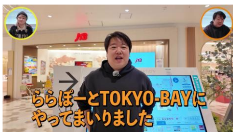
【本編 | ニシダさん正解発表ロケシーン】