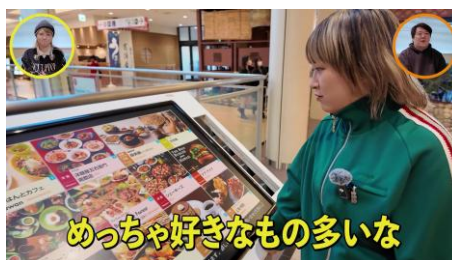
【本編 | サーヤさん正解発表ロケシーン】